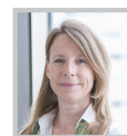
IRIS INTERNATIONAL RELATIONS IN SCIENCE